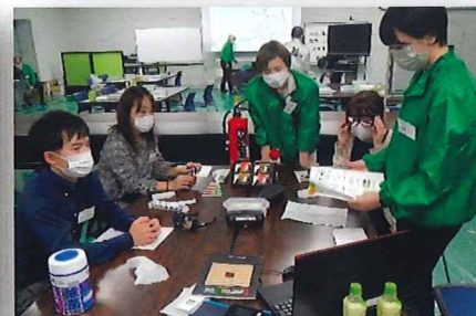
カラーユニバーサルデザイン 疑似体験